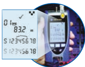
Wiremap met lengte aanduiding

Verbindingsproblemen hebben niet altijd de bekabeling als oorzaak, daarom is de VDV II Pro voorzien van functies om service gerelateerde problemen te herkennen. Door het detecteren van spanning en polariteit herkent de VDV II Pro welke media service aanwezig is op de kabel zoals ISDN, PBX en PoE (Power over Ethernet). Het resultaat is een snellere diagnose. Het zoeken naar problemen in actieve Ethernet netwerken is ook gemakkelijker gemaakt door de ingebouwde netwerk detectie welke de netwerksnelheid en duplex informatie weergeeft. Tenslotte zijn, om schade aan de testers te voorkomen, alle VDV II modellen voorzien van een slimme detectie van spanning op een aansluiting.